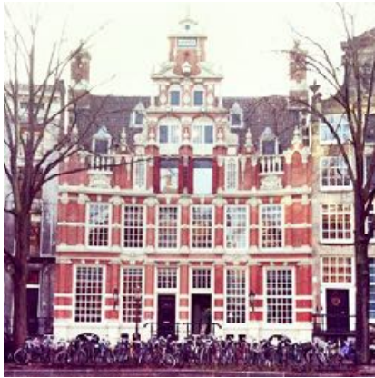
1. Huis Bartolotti – Amsterdam