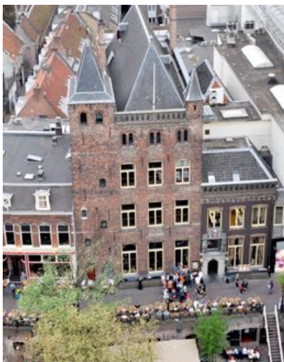
2. Huis Oudaen – Utrecht