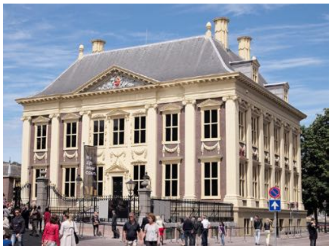
5. Mauritshuis – Den Haag