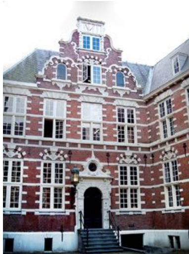
4. Oost-Indisch Huis – Amsterdam