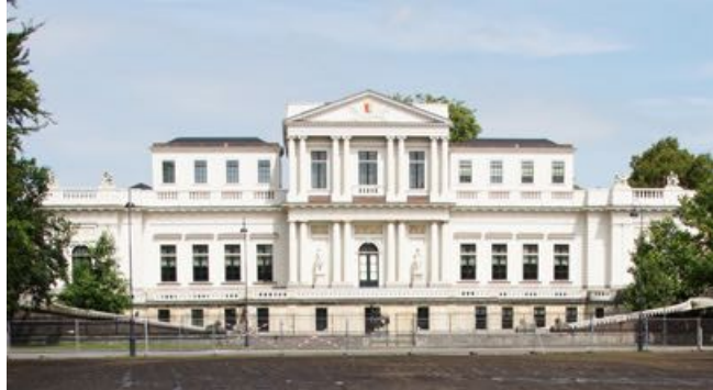
3. Provinciehuis Noord Holland – Haarlem

Hieronder zie je vijf afbeeldingen van huizen. Twee ervan zijn gebouwd in de stijl 'Hollandse Renaissance'. Omcirkel deze huizen.